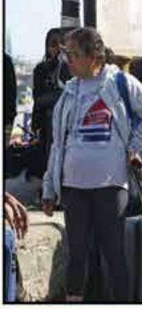
ਚੀਨ ਪਾਕਿਸਤਾਨ ਦਾ ਬਦਲਾ ਲਵੇਗਾ?

ਸਿੰਧੂ ਨਦੀ ਦੀ ਚੀਨ ਤੋਂ ਨਿਕਲਦੀ ਹੈ, ਇਸ ਲਈ ਜੇਕਰ ਭਾਰਤ ਸਿੰਧੂ ਨਦੀ ਦੇ ਪਾਣੀ ਨੂੰ ਪਾਕਿਸਤਾਨ ਜਾਣ